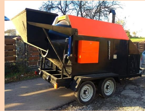
Придбано рециклер асфальто-бетону, вібраційний каток та ескаваторне обладнання