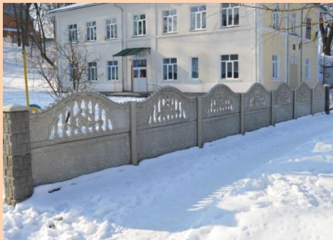
Заміна вікон, дверей та огорожі в Завадківській ЗОШ I-II ст.