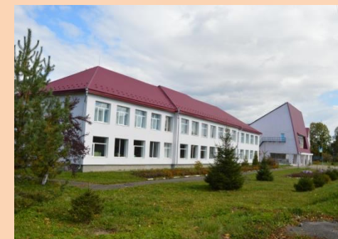
Капітальний ремонт даху Верхнянської ЗОШ І-ІІІ ст.