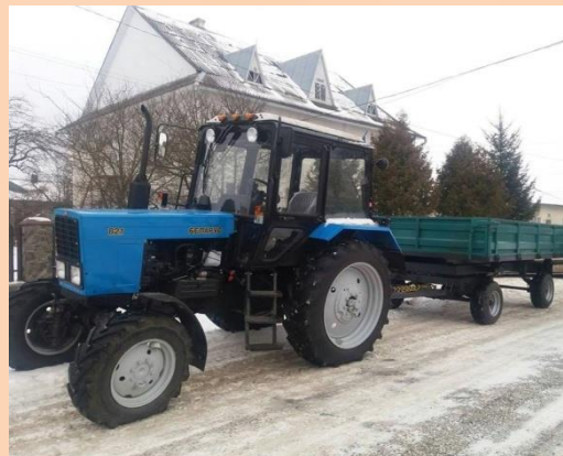
Придбано спецтехніку (трактор, причіп, обладнання та навісне обладнання)