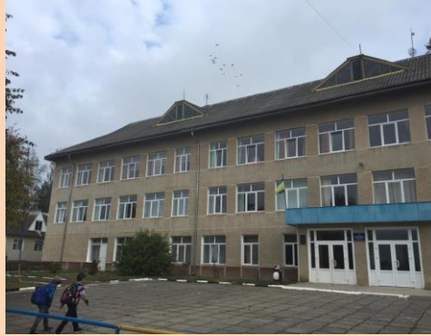
Заміна вікон в Зборянському НВК I-II ст.