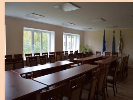
Капітальний ремонт приміщення спального корпусу пришкольного інтернау під амінприміщення в с.Верхня