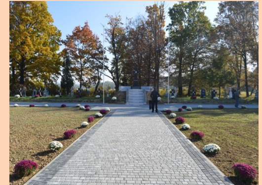
Облаштовано "Сквер пам'яті минулих літ" в с.Болохів