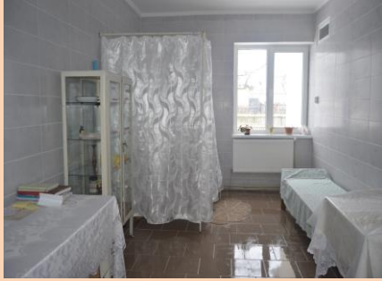
Капітальний ремонт ФАПу в с.Степанівка