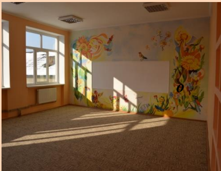
Капітальний ремонт Довговойнилівського НВК І-ІІІ ст. з відкриттям дошкільної групи