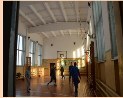
Капітальний ремонт спортзалу Довговойнилівського НВК І-ІІІ ст. та утеплення теплотраси