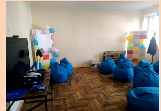
Облаштовано та відкрито мультимедійний лекторій "Community Space" (громадський простір) в с.Верхня