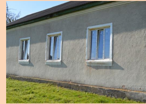
Капітальний ремонт Народного дому в с.Негівці (заміна підлоги на сцені, вікон та дверей)