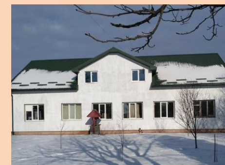
Капітальний ремонт амбулаторії ЗПСМ в с.Верхня