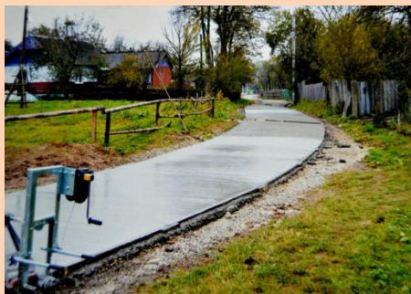
Ремонт комунальної дороги в с.Болохів