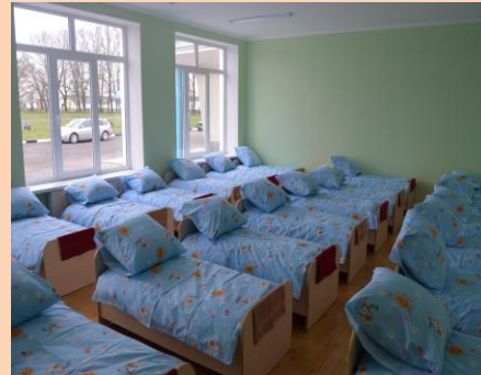
Капітальний ремонт Негівського НВК І-ІІ ст. з відкриттям дошкільної групи