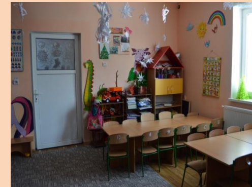
Капітальний ремонт та відкриття НВК І ст. в с.Степанівка