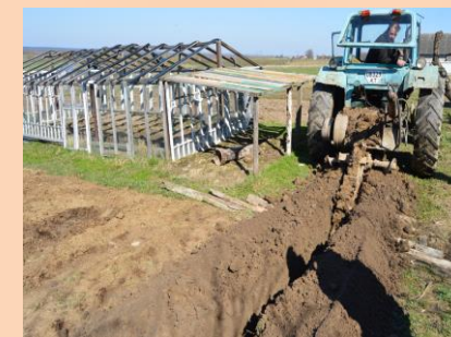
Будівництво централізованої системи водопостачання в с.Верхня по вул.Калуська та Войнилівська (6,2 км)