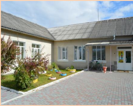
Заміна віконних блоків на металопластикові в ДНЗ ясла-сад «Колобок» с.Верхня